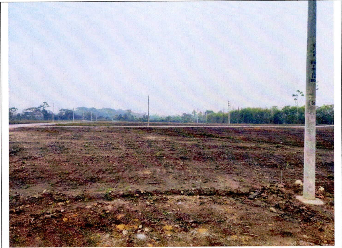
Fotografía N° 3 Área nivelada y lotizada.