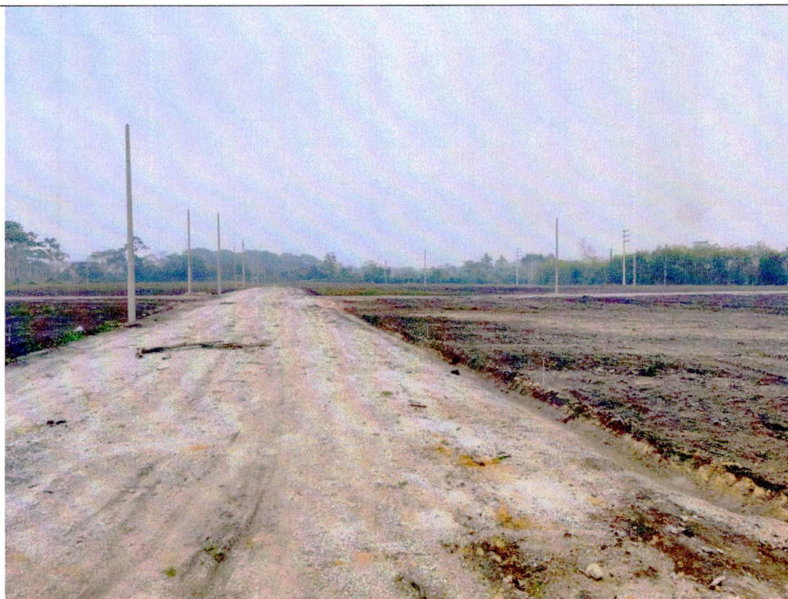
Fotografía N° 2

Vista del acceso a la que fue el área de actividad minera.