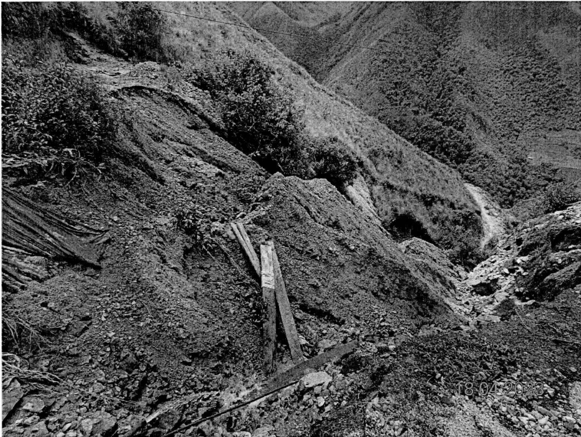
Fotografía N° 3: Vista de la desmontera