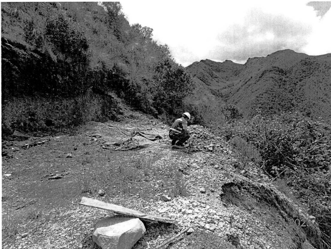
Fotografía N° 2: Vista de la cancha de mineral.