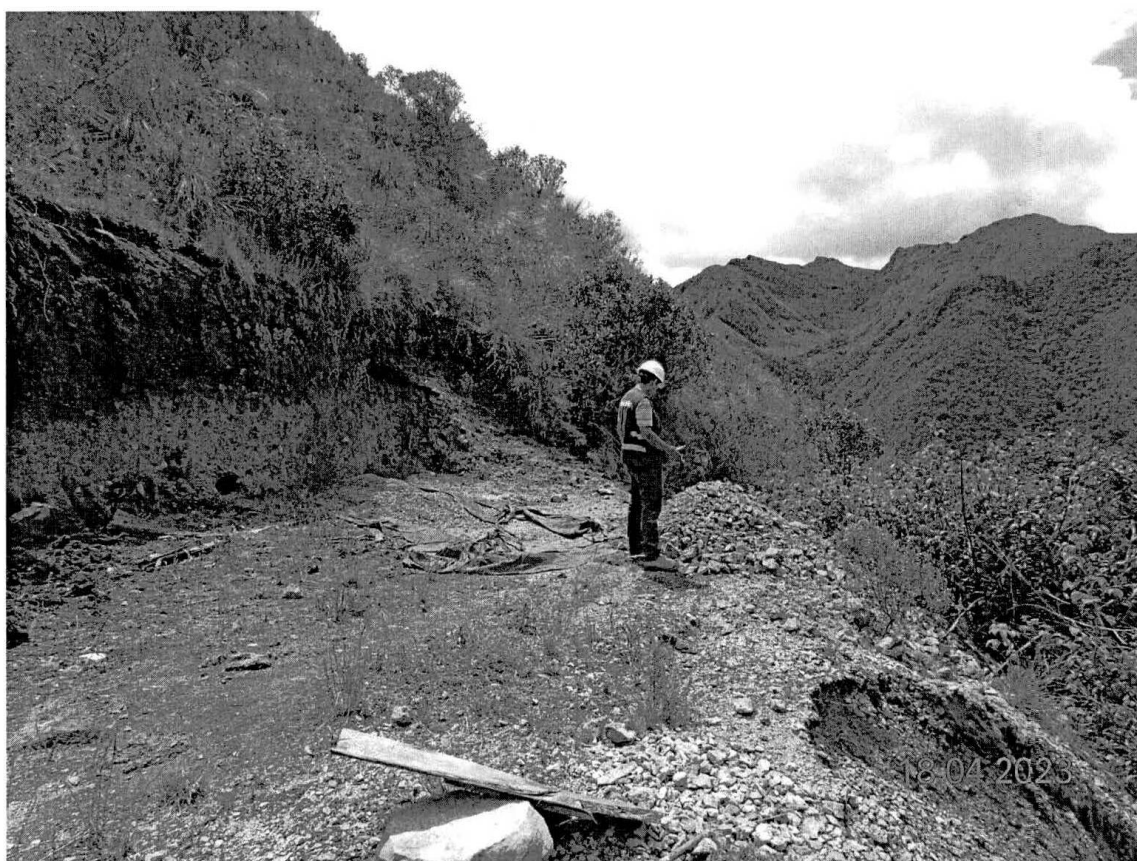
Fotografía N° 2: Vista de la cancha de mineral.