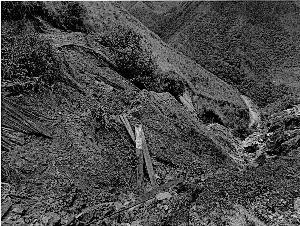
Fotografía N° 3: Vista de La desmontera.