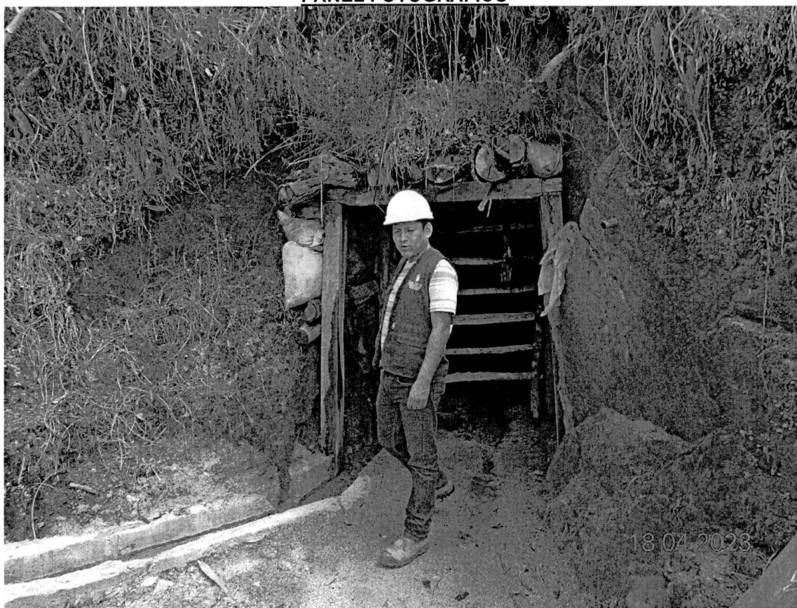
Fotografía N° 1: Vista de la bocamina.